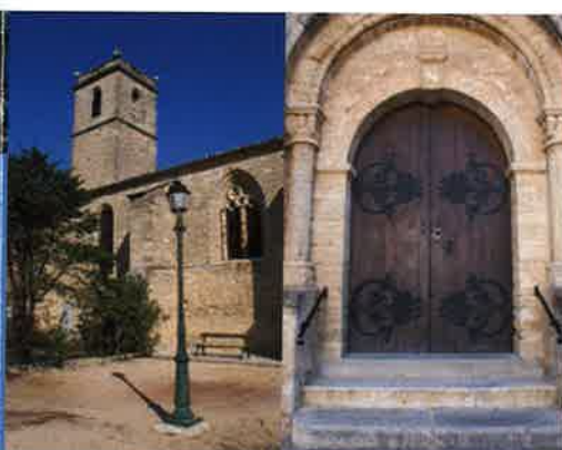
Église Saint Martin