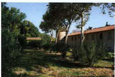
Domaine de Peyrat