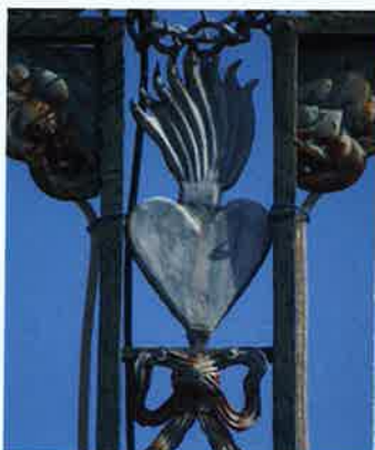
Croix de mission