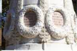
Monument aux morts