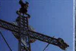
Croix de mission