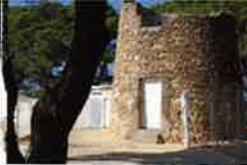
Le Moulin à vent