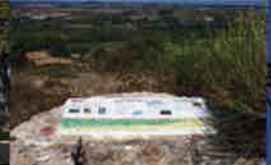
Le Travers : table d'orientation